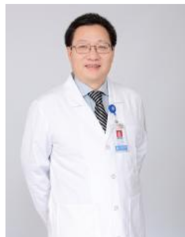
傅国胜,教授、主任医师、博士生导师、附属邵逸夫医院心内科主任 专长:心血管领域多种疑难杂症的诊断和治疗,冠心病介入治疗